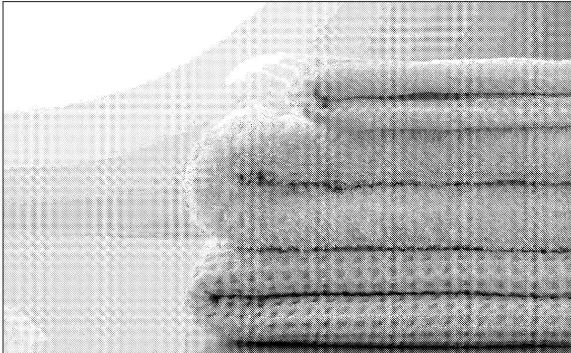
Die Wahl der Wäsche ist wichtig für Stil und Anmutung des Hotels. Für Auswahl und Pflege gibt es Modelle von Leasing und Outsourcing.

Outsourcing. Wäsche. Einige Hotels lassen ihre Wäsche extern waschen. Die Gründe dafür sind unterschiedlich. Das Grand Resort Bad Ragaz beispielsweise will seinen Energieverbrauch halbieren.